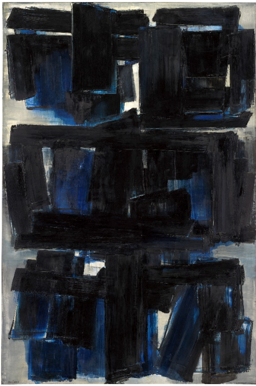
皮耶·蘇拉吉，《繪畫 195 x 130 厘米，1957年10月30日》 (Peinture 195 x 130 cm, 30 octobre 1957)，1957年作，油彩畫布，195 x 130 厘米 (76 3/4 x 51 3/16 吋) © 2019年紐約Artists Rights Society (ARS) / 巴黎ADAGP。鳴謝：華盛頓國家藝廊。

紐約—為慶祝法國偉大藝術家皮耶·蘇拉吉(Pierre Soulages)的百歲壽辰，厲為閣欣然呈獻「Pierre Soulages: A Century」展覽，展出他自 1950 年代至今所創作的精彩作品。展覽將於 2019 年 9 月 5 日至 10 月 26 日舉行，旨在探討蘇拉吉在歐美繪畫的對話中一直扮演的重要角色，並邀請觀眾思考其創作方式的影響。他始堅持只使用黑色顏料，為前衛抽象作品注入濃厚的詩意。